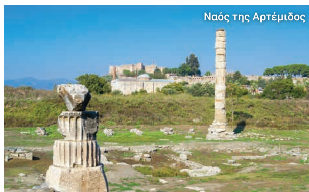
Ναός της Αρτέμιδος

ανακατασκευασμένη, Βιβλιοθήκη του Κέλσου και η Αγορά. Το Μεγάλο Θέατρο της Εφέσου όπου κάποτε κήρυττε ο Άγιος Παύλος, φιλοξενούσε έως και 24.000 άτομα. Σήμερα φιλοξενεί συναυλίες και άλλες παραστάσεις. Καθ' οδόν θα κάνουμε μια στάση για να αγοράσετε αναμνηστικά, χαλιά, κοσμήματα, δερμάτινα, κ.λπ. και να απολαύσετε ένα ελαφρύ μεσημεριανό. Στη συνέχεια, κατευθυνόμαστε στην αρχαία παραλιακή πόλη της Μιλήτου, άλλη μία από τις μεγαλύτερες και πλουσιότερες πόλεις της Αρχαίας Ελλάδας και μία από τις πρώτες που έκοβαν νομίσματα. Ο Όμηρος ανέφερε τη Μίλητο στην Ιλιάδα και ο Παύλος κήρυξε εδώ καθ' οδόν για την επιστροφή του στην Ιερουσαλήμ. Υπάρχουν πολλά καλά διατηρημένα ερείπια εδώ, όπως ο ναός του Απόλλωνα και μια βυζαντινή εκκλησία.