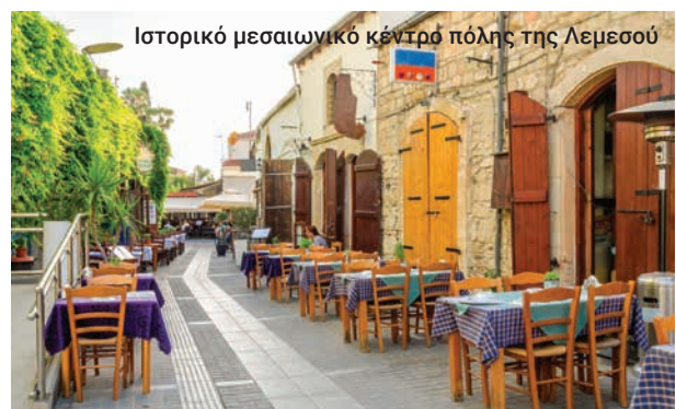
Ιστορικό μεσαιωνικό κέντρο πόλης της Λεμεσού

Το αμφιθέατρο έχει αναστηλωθεί και χρησιμοποιείται πλέον για μουσικές και θεατρικές παραστάσεις, ενώ παράλληλα αποτελεί σημαντικό τουριστικό αξιοθέατο.