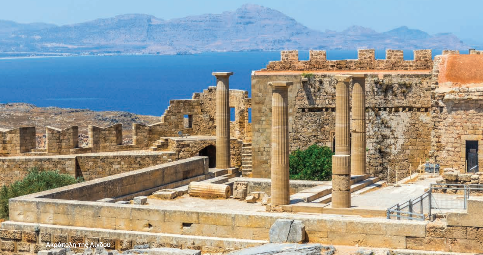
Ακρόπολη της Λίνδου