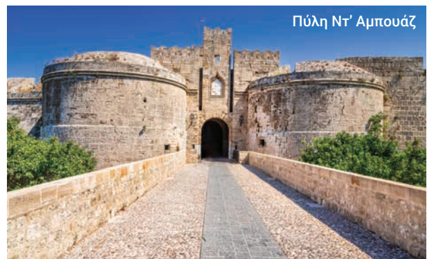
Πύλη Ντ' Αμπούζ

Όπως και να έχει, αυτή η ξενάγηση μας μεταφέρει στην καρδιά της συναρπαστικής ιστορίας της Ρόδου.