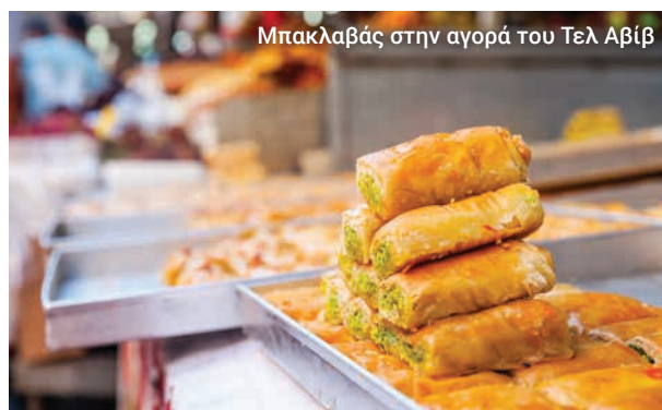
Μπακλαβάς στην αγορά του Τελ Αβίβ

Θα επισκεφτούμε την πολύχρωμη αγορά Carmel και θα γνωρίσουμε τα αξιοθέατα και τους ήχους αυτής της μοναδικά ζωντανής μητρόπολης.