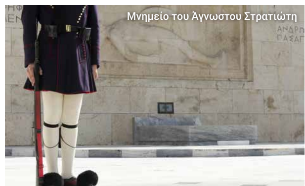
Μνημείο του Άγνωστου Στρατιώτη