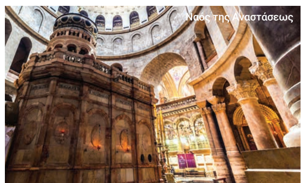
Ναός της Αναστάσεως

Στη συνέχεια ταξιδεύουμε στη Βηθλεέμ, η οποία βρίσκεται στη Δυτική Όχθη, για να επισκεφτούμε τον τόπο της γενέτειρας του Ιησού, τη Βασιλική της Γεννήσεως και την Πλατεία Μαντζέρ. Απολαμβάνουμε το μεσημεριανό μας γεύμα στη Βηθλεέμ και έχουμε χρόνο για την αγορά σουβενίρ προτού επιστρέψουμε και πάλι στο λιμάνι.