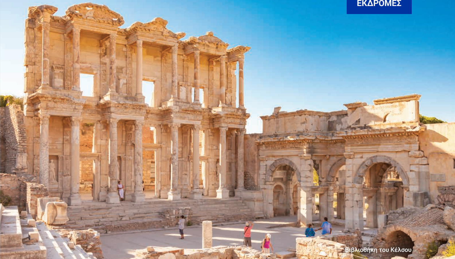
Βιβλιοθήκη του Κέλσου