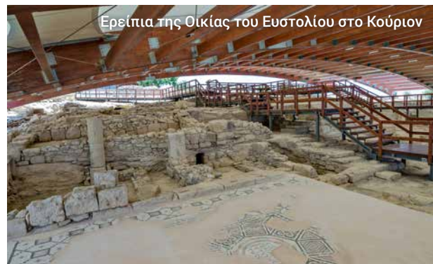
Ερείπια της Οικίας του Ευστολίου στο Κούριον

Μετά το μεσημεριανό, επισκεπτόμαστε τη Μονή Τιμίου Σταυρού και το μεσαιωνικό πατητήρι. Θα απολαύσουμε μια ιδιαίτερη οινογευσία στο κελάρι ενός χωρικού πριν επιστρέψουμε και πάλι, μέσα από την πολύχρωμη πόλη της Λεμεσού, στο λιμάνι όπου μας περιμένει το πλοίο μας.