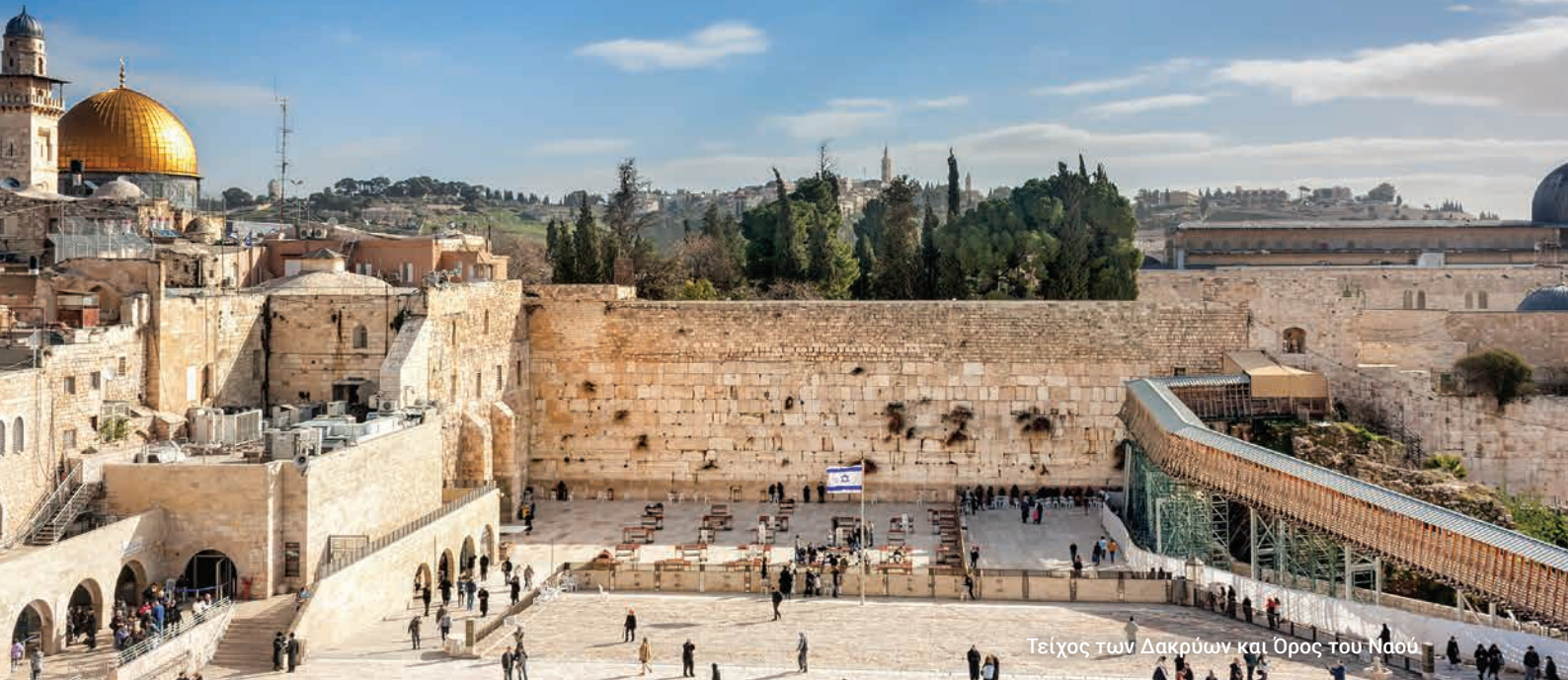
Τείχος των Δακρύων και Όρος του Ναού