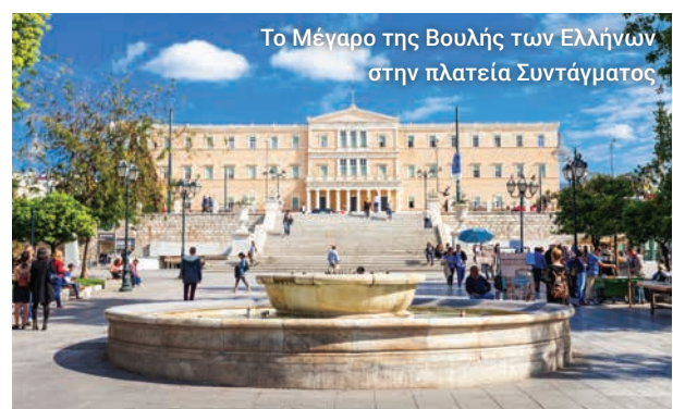
Το Μέγαρο της Βουλής των Ελλήνων στην πλατεία Συντάγματος

Στο τέλος της διαδρομής μας, ελπίζουμε να έχετε γνωρίσει καλά τα μεγαλειώδη μνημεία της κλασικής Αθήνας και να έχετε διαμορφώσει μια καλύτερη ιδέα για μία από τις πιο ιστορικά σημαντικές πρωτεύουσες στον κόσμο.