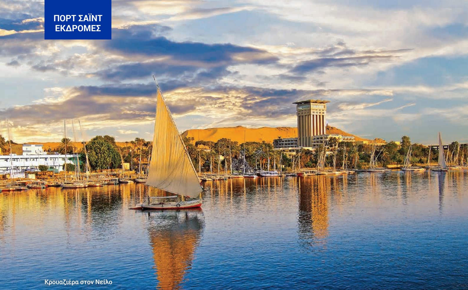
Κρουαζιέρα στον Νείλο