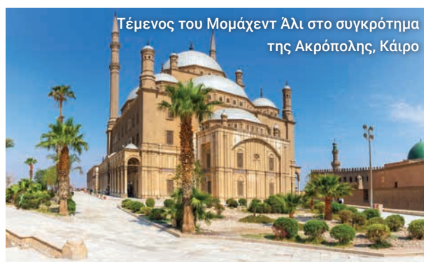
Τέμενος του Μοχάμεντ Άλι στο συγκρότημα της Ακρόπολης, Κάιρο

Προσδένουμε στο λιμάνι και μεταφερόμαστε στην Ακρόπολη του Σαλαντίν και στο Αλαβάστρινο Τέμενος του Μοχάμεντ Άλι, όπου μπορούμε να θαυμάσουμε τους εξαιρετικούς εσωτερικούς χώρους και τον συναρπαστικό ορίζοντα του Παλιού Καΐρου από την κορυφή του λόφου. Κάνουμε την τελευταία μας στάση σε ένα Ινστιτούτο Παπύρου για να δούμε την αρχαία τέχνη της μετατροπής των καλαμιών σε χαρτί και μετά θα έχουμε λίγο χρόνο για ψώνια πριν επιστρέψουμε στο πλοίο μας στο Πορτ Σάιντ.